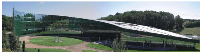
Les Cauquillous, Firmensitz von Pierre Fabre Dermo-Cosmétique

Heute bieten die Laboratoires Ducray von PIERRE FABRE DERMO-KOSMETIK Expertenprodukte für zahlreiche Haar- und (Kopf-) Hautprobleme. Die Marke hat daher seit Jahrzehnten die anerkannte Kompetenz in der Dermatologie und entwickelt stetig neue, innovative Pflegeprodukte in Zusammenarbeit mit renommierten Forschern und Hautärzten. Das Ziel damals wie heute: für jedes Haar- und Hautproblem wirksame und zugleich kosmetisch angenehme Lösungen bieten zu können.