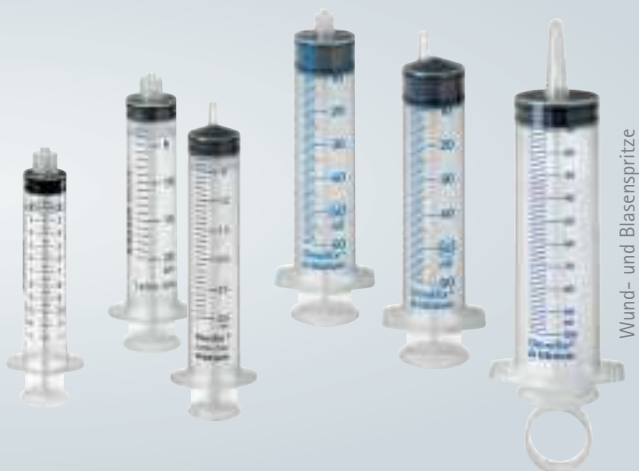
Wund- und Blasenspritze