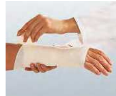
Für stützende und entlastende Verbände an viel bewegten Körperteilen.