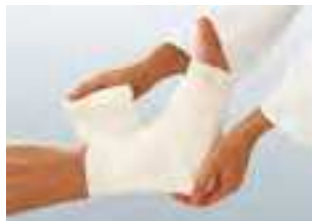
Uniflex® Universal/Uniflex® Color sitzen auch an viel bewegten Gelenken fest und sicher.