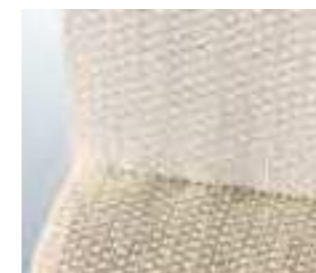
Ihre Kohäsivität verdankt Unihaft® dem mikroporösen Latexauftrag.

Unihaft® besteht aus 77 % Baumwolle, 22 % Polyamid und 1 % Elasthan.