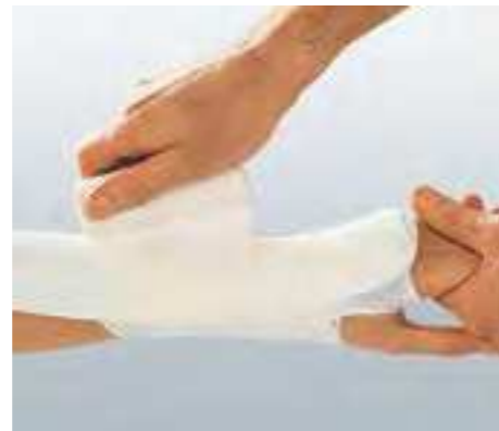
Für fixierende und unterstützende Verbände.