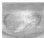
Vor der Behandlung