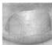
Nach der Behandlung