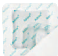
Askina® DresSil Border