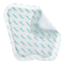
Askina® DresSil Sacrum