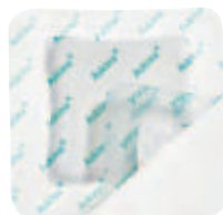
Askina® DresSil Border