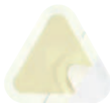
Askina® Transorbent® Sacrum