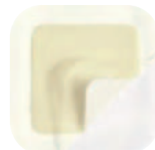
Askina® Transorbent® Border