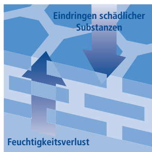
Die Hornschicht schützt die Haut vor Feuchtigkeitsverlust und dem Eindringen schädlicher Substanzen.

Die sehr wirkungsvolle Schutzfunktion der Hautschutzbarriere resultiert hauptsächlich aus der einzigartigen Struktur und Zusammensetzung ihrer Lipide. Durch verschiedene Faktoren, wie z. B. häufiges Waschen, Trockenheit, Kälte und Wind kann die Hautschutzbarriere in ihrer Funktion beeinträchtigt werden. Dann verliert die Haut zum einen viel Feuchtigkeit und lässt zum anderen Schad- und Reizstoffe sowie Allergene leichter eindringen. Trockene Haut ist oft auch nicht mehr in der Lage, ausreichend eigene Lipide zu bilden und reagiert häufig sehr empfindlich. In diesem Fall müssen der Haut Lipide von außen zugeführt werden, die in ihrer Zusammensetzung so weit wie möglich den körpereigenen Hautlipiden entsprechen, sogenannte physiologische Lipide. Ihr einzigartiger Nutzen besteht darin, dass dies die einzigen Lipide sind, die von der Haut aufgenommen und für den Aufbau der Hautschutzbarriere direkt verwendet werden können. Zu diesen physiologischen Lipiden zählen die Ceramide und Cholesterol.