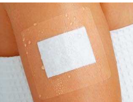
Curapor® transparenter Wundverband steril