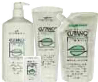
Waschpflege fest 100 g Waschpflege flüssig 200 ml Waschpflege flüssig 500 ml im Spender Waschpflege flüssig 500 ml im Nachfüllpack