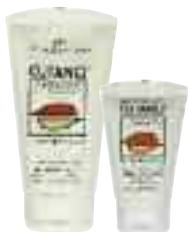
Pflegebalsam 150 ml Pflegecreme 50 ml