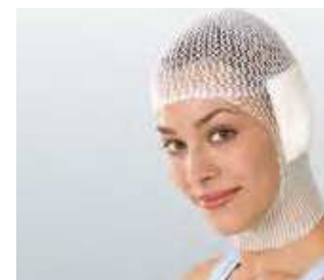
Einfache und schnelle Applikation.

Elastofix® besteht aus 55 % Baumwolle, 25 % Elastodien und 20 % Polyamid.