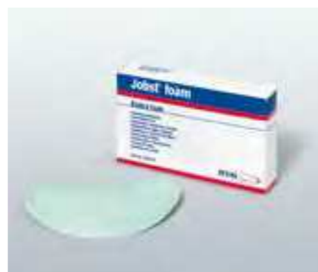
Für die gleichmäßige Kompression.