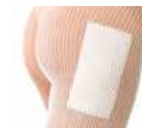
Elastofix® Netzschlauch fixiert sicher und passt sich der Körperoberfläche gut an, ohne Stauungen und Abschnürungen zu verursachen.