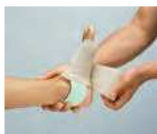
JOBST® foam passt sich jeder Körperkontur an.

JOBST® foam besteht aus synthetischem Latex.