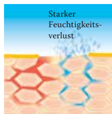
Lipidverlust führt zu einer gestörten Hautbarriere: Die Haut verliert viel Wasser und trocknet aus.