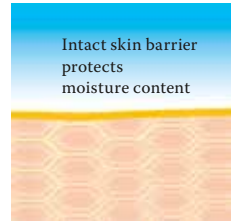
Intact protective skin barrier with lipids rich in linoleic acids.

Visit us at www.linola.de and select the dropdown menu "country". Here you will find all the latest information on Linola Lotion , Linola Face , Linola Hand and Linola Foot Lotion as well as other Linola products for a wide range of skin problems.