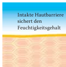
Intakte, schützende Hautbarriere mit Linol-säure-reichen Lipiden.

Besuchen Sie uns unter www.linola.de . Denn dort haben wir für Sie alle aktuellen Informationen über Linola Hautmilch , Linola Gesicht , Linola Hand und Linola Fuß-Milch sowie zu weiteren Linola-Produkten bei verschiedenen Hautproblemen bereitgestellt.