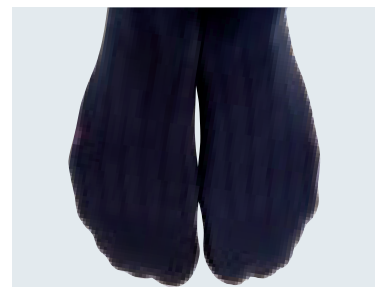
Anatomisch geformte Fußspitze mit praktischer Rechts- / Linkskennzeichnung