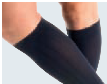
Kniestumpf im modischen „Business-Ripp-Design“ mit Komfort-Bündchen