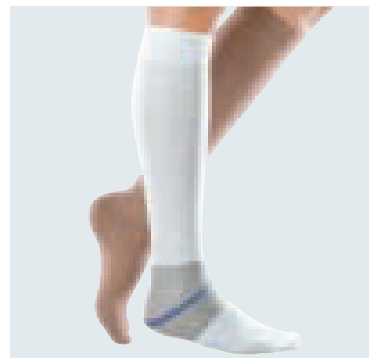
mediven ulcer kit