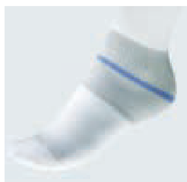
Farbmarkierung für exakte Positionierung