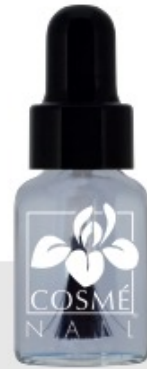
VITAMIN BASIS N°2