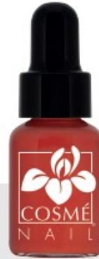
FARB in zwei Schichten N°202