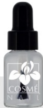
FARBLOS NAGELHÄRLR N°1