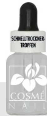
SCHNELLTROCKNER- TROPFEN N°202