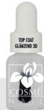
TOP COAT GLANZEND 3D N°207