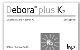
Vitamin D 3 + Vitamin K 2