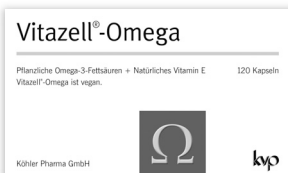
Pflanzliche Omega-3-Fettsäuren + natürliches Vitamin E