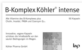
Alle Vitamine des B-Komplexes plus Cholin, Inositol, PABA und Coenzym Q 10