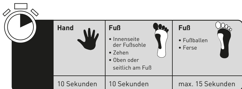
TABELLE ZUR BESTIMMUNG DER BEHANDLUNGSDAUER:

Bestimmen Sie die richtige Anwendungsdauer (10 oder 15 unterbrochene Sekunden, siehe Tabelle unten) gemäß der nachstehenden Tabelle und halten Sie eine Stoppuhr bereit.